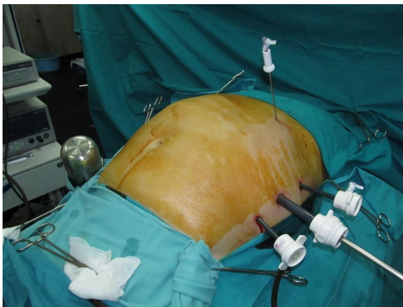
Slika 1. Pozicija pacijenta i trokara kod laparoskopске operacije

Prvu laparoskopsku operaciju na psima izveo je Georg Keling u Drezdenu (Nemačka) 1902. godine, dok je prvu laparoskopsku operaciju na ljudima uradio i objavio članak Hans Kristijan Jakobeus 1910. godine u Švedskoj, koji je konstruisao i prve laparoskopске instrumente. Dugo zatim je laparoskopска hirurgija ostala neprimetna sve do sedamdesetih godina prošlog veka kada počinju da se pojavljuju prvi stručni radovi o laparoskopским operacijama u ginekologiji, da bi 1981.godine Kurt Semm u Nemačkoj uradio prvu laparoskopsku operaciju slepog creva što označava početak ere razvoja moderne laparoskopске hirurgije. Tehnička dostignuća u drugoj polovini XX veka bili su predulsov za razvoj endoskopske hirurgije. Razvojem video tehnologije i specifičnog laparoskopskog instrumentarijuma i druge opreme (ultrazvučni nož, ligasure, bipolarne struje, laparoskopски ultrazvuk), laparoskopска hirurgija je osvojila praktično sve organe trbuha i njihove operacije koje su se vekovima radile na otvoreni način, a video oprema i kamere su davali uvećanu i jasnu sliku u trbušnoj duplji koja je omogućila izvođenje najsluženijih hirurških zahvata bez otvaranja trbuha velikim rezom. Važno je istaći da se operativni zahvat laparoskopским pristupom u samoj trbušnoj duplji radi po istim principima i sa istom efikasnošću kao i otvoreni hirurški zahvat.